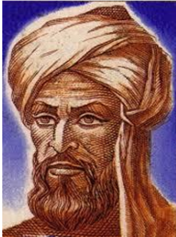
Al Khwarizmi, peletak dasar-dasar logika